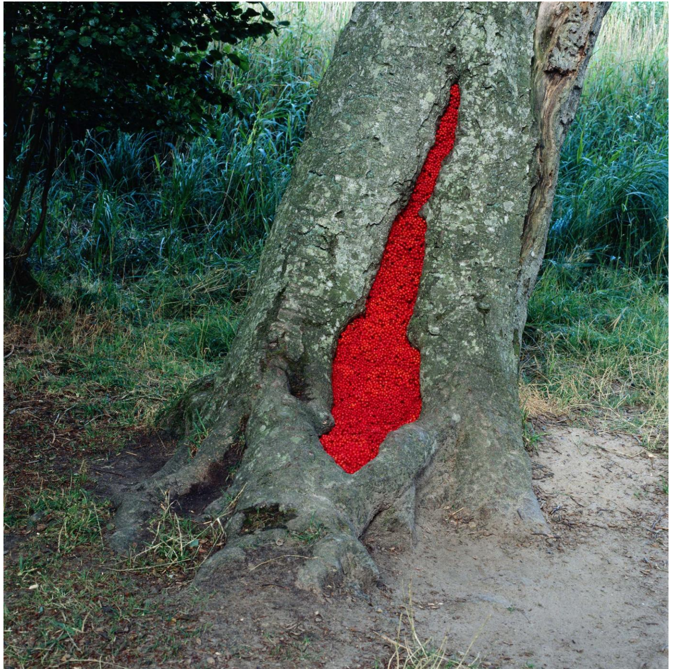
Nils-Udo, sans titre, 1993, hêtre, sorbes, Langeland, Danemark, Ilfochrome sur aluminium, 98x98cm