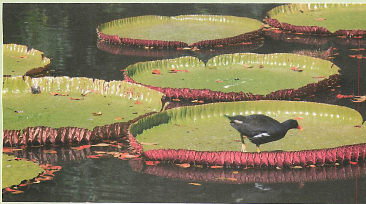
Des nénuphars aux larges feuilles flottantes, Île Maurice.

LES AQUATIQUES naissent au fond de l'eau, s'étalent et flottent à la surface des bassins et des mares.