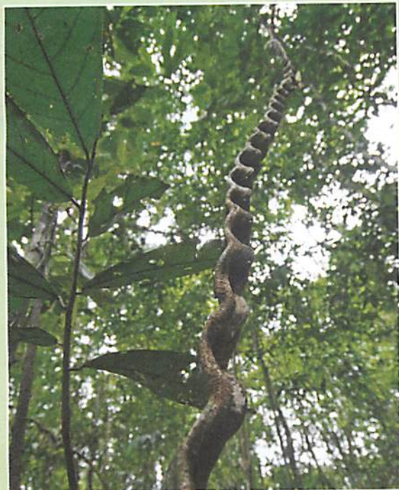
Une liane, dite « escalier de singe », Amazonie.

LES GRIMPANTES s'élèvent toujours plus haut. Certaines, comme la glycine ou les lianes, s'enroulent autour d'un support pour monter. D'autres, comme le lierre ou la vigne vierge, s'accrochent sur un mur ou un arbre à l'aide de petites racines.